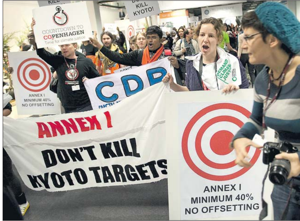
Manifestants contra el canvi climàtic a Copenhaguen.

Sigui des del punt de vista ambiental o l'econòmic, sens dubte les nostres illes són les que més perdran i on l'impacte serà més acusat. Conscients de la situació, nou empreses de Balears van constituir a mitjans de juliol la Fundació +O2. Una iniciativa privada d'un grup d'empreses com-